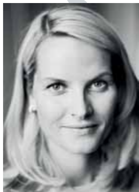
H.K.H. KRONPRINSESSE METTE-MARIT Oslo Internasjonale Kirkemusikkfestivals høye beskytter